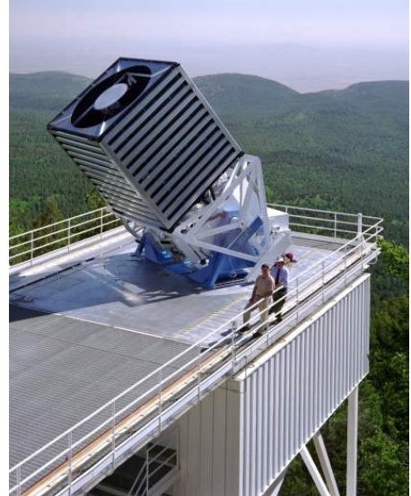
A Sloan Digital Sky Survey teleszkóp

Az elmúlt évek során a Human Genome projekthez hasonlóan az Univerzumból is elkészült egy minden eddiginél részletesebb térkép. A Sloan Digital Sky Survey az égbolt egy negyedét mérte fel, mintegy 300 millió galaxisról készített fényképeket, és mintegy 800.000 galaxis távolságát állapította meg. Mindez az adatmennyiség az Interneten keresztül közvetlenül elérhető. Az új internetes technológiák (mashup stb) segítségével a Sloan project adataira épült a Google Sky, Microsoft World Wide Telescope és a GalaxyZoo project. Ez utóbbi projektben önkéntesek, nagyrésztük gimnazista, egymillió galaxis képét osztotta különböző